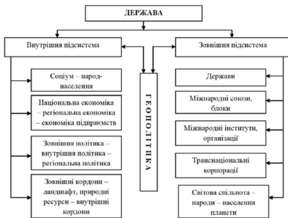
Рис. 1. Місце геополітики в державній системі

Поширеною класифікацією функцій держави є їх поділ на внутрішні та зовнішні, хоча з поглибленням глобалізаційних та інтеграційних процесів у світі межа між ними зникає. Виходячи з цього, державу як систему можна представити у вигляді внутрішньої та зовнішньої підсистем, інтегративну функцію між якими буде відігравати геополітика. Адже геополітика виступає тим механізмом, який показує засади міжнародної політики та її вплив на внутрішній розвиток держави (рис. 1).