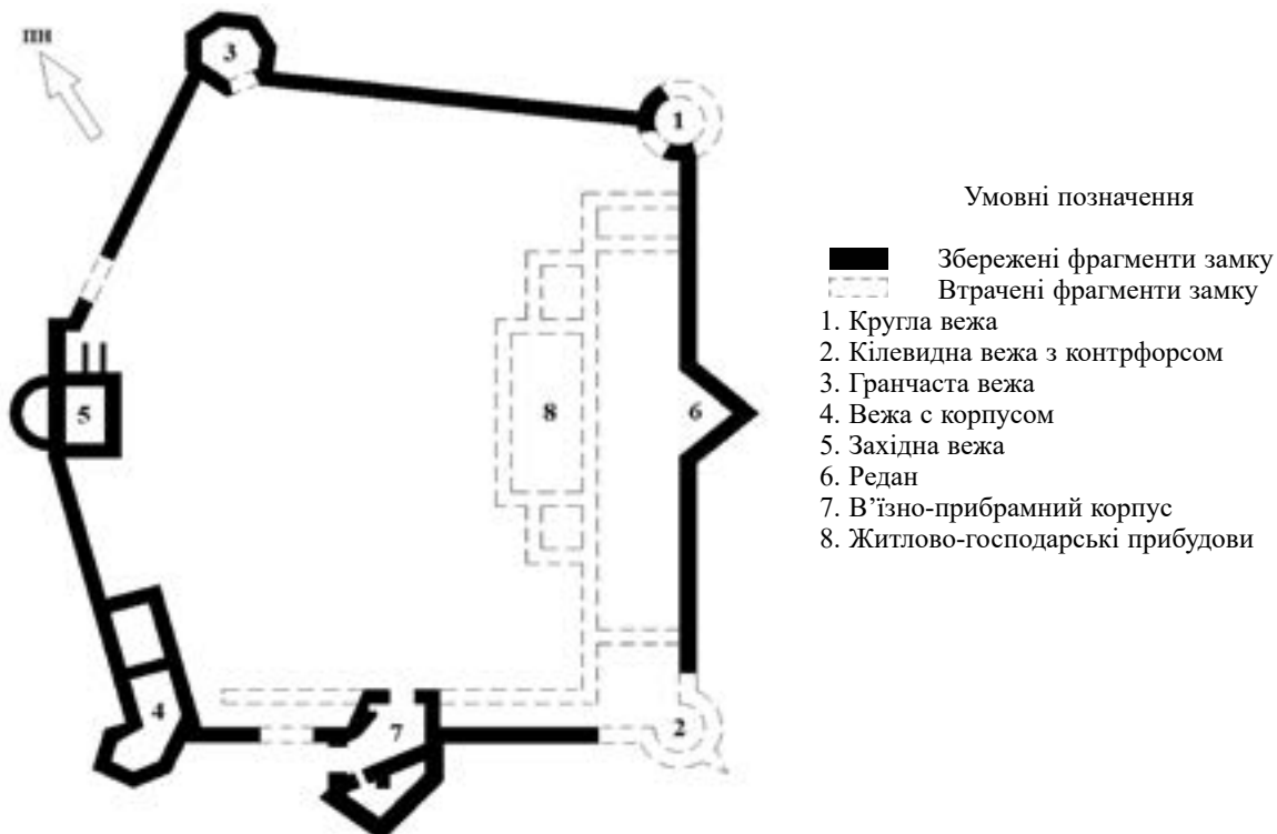
Рис. 2. План-реконструкція Пнівського замку. Креслення автора

За кількістю збережених елементів (але не за їх якістю) Пнівський замок займає перше місце на Івано-Франківщині серед подібних пам'яток, зберігшись приблизно наполовину від первісного стану. Об'єкт має форму неправильного п'ятикутника з сімома вежами (п'ять збереглися), які розташовані по всьому периметру зовнішніх стін та кардинально відрізняються між собою за формою, висотою, функціональним призначенням, датою побудови та п'ятьма твірними стінами (рис. 2). Кутових веж п'ять, серед яких: дві зруйновані – східна Кругла (сильно пошкоджена в 2010 р. внаслідок повені) та Кілевидна вежа з контрфорсом (розібрана аж до фундаменту ще в XIX ст.); три уцілілі – шестигранні північна Гранчаста та південна вежа з корпусом, а також Західна прямокутна вежа з напівкруглим виступом. Під вежами знаходяться підземні лабіринти, входи до яких засипані. На стику південної і східної стін зберігся трикутний виступ (редан) з двома ярусами бійниць, який виконував роль башти. Остання вежа, що існує по сьогоднішній день, – це в'їзна, яка побудована у формі склепіння та сильно пошкоджена, але прибрамний корпус у вигляді неправильного чотирикутника та зокрема заокруглена арка в'їзних воріт уціліли. На фасаді башти є навіть ніша для моста, а всередині – дерев'яний блок для ланцюгів. Серед замкових стін у найкращому стані перебуває північна, яка не втратила своєї цілісності й первозданної висоти, на ній частково існує навіть штукатурка. Східна стіна,