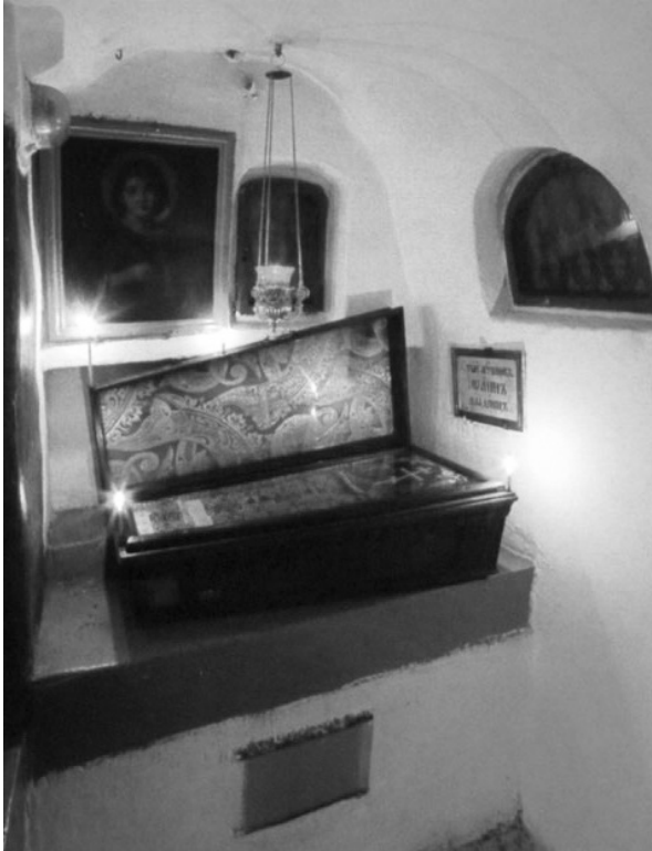
Рис. 2. Мощі св. мч. Іоанна Немовляти (сучасний вигляд) [44].

змогу вільно пройти повз того, хто взяв на руки домовинку поза часом, відведеним для богослужіння. Натомість розмір і вага труни могли завадити поширенню замовних служб із нею на руках, на відміну від випадку з ковчежцем св. Віфлеємського немовляти.