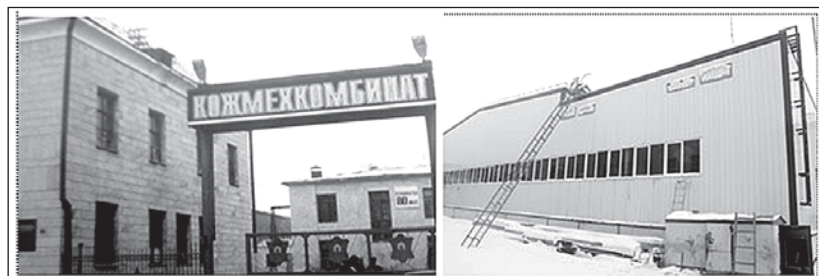
Рис.18-19. От архитектурного интерьера 30-х годов XX в. к современным апартаментам кожевенно-мехового производства

Реконструкция кожевенного производства осуществляется комбинатом совместно с АО «Банк Развития Казахстана». Ввод в эксплуатацию нового кожевенного завода, оснащенного современным итальянским оборудованием последнего поколения, позволит значительно сократить