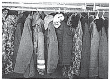
Рис.10-17. Основные цеха ТОО «Семипалатинский кожевенно-меховой комбинат»

скасть и более качественные, и новые виды продукции. Реконструкция и модернизация комбината состоит из 3-х этапов: первый этап , реконструкция и модернизация кожевенного производства; второй этап , реконструкция и модернизация овчинно-шубного и швейного производств; третий этап , реконструкция и модернизация