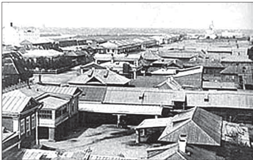
Рис.1. Семипалатинск во второй половине XIX в. Вид с восточной стороны

В 1854 г. в Семипалатинске проживало 18864 человека [2, с.45]. Значительное влияние на развитие