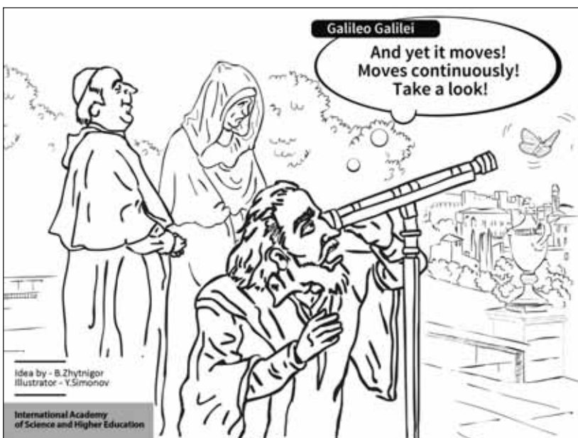
Idea by - B.Zhytnigor Illustrator - Y.Simonov International Academy of Science and Higher Education