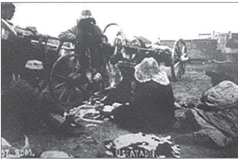
Рис.3. Ярмарка на территории Семипалатинска. Вторая половина XIX в.

Значительный рост товарооборота мотивировал развитие капиталистических форм кредитования. В 1887 г. был открыт Городской банк. Активы банка с 19,9 млн. руб. в 1893 г. выросли до 35 млн. руб. в 1905 г. [4, с.46]. Еще более оживилась экономическая жизнь края после открытия Сибирской железной дороги. Согласно имеющимся отчетам за 1888 г., по Семи-