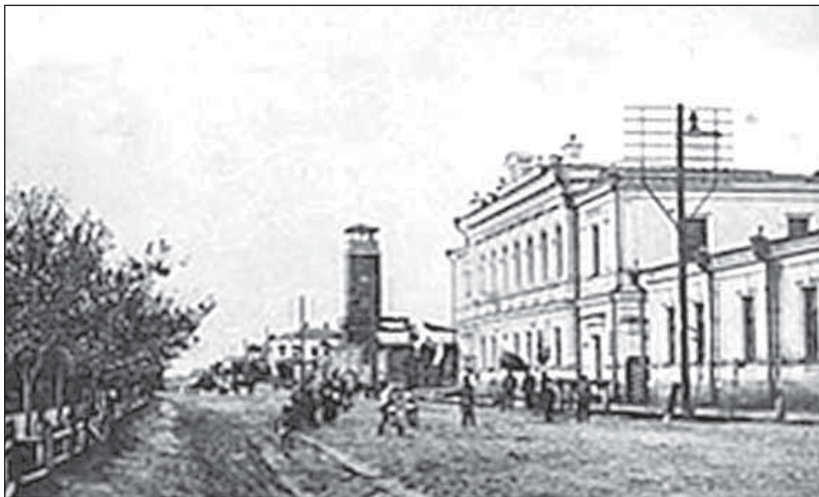
Рис.2. Семипалатинск в начале XX в.

Улица Кольванская (ныне Интернациональная). Сквер Никольского собора (ныне Центральный парк), деревянная каланча (сегодня на этом месте – каменная) и здание Городского банка (ныне здесь размещается финансово-экономический колледж)