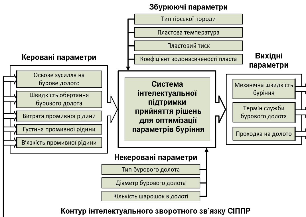
Рисунок 2 – Структурна схема моделі прийняття оптимальних рішень в процесі буріння нафтових і газових свердловин роторним способом

Процес міркувань експертів (операторів процесу буріння) можна розглядати як випадок розподіленої проблеми задоволення обмежень, в якій обмеження кожної частини є розділеними між інтелектуальними складовими, що виконують обмін інформацією з метою пошуку рішення, що задовольняє всі накладені обмеження. Відповідно в процесі побудови узгоджень щодо висновку виконується ітеративний обмін переважними рішеннями у формі пропозиційних тверджень з відповідним послабленням їх переважності та обмежень відповідно до типових евристичних стратегій, доки не буде задоволено всі обмеження і досягнуто загального узгодження стратегії.