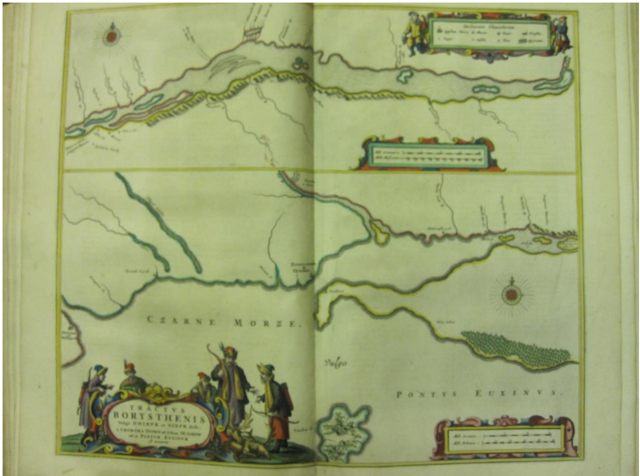
Рис. 6. Карта Г. Боплана «Русло Дніпра від острова Хортиці до Чорного моря»

Третьою картою із серії Tractvs Borysthenis Г. Боплана є карта русла Дніпра від острова Хортиці до Чорного моря (Tractvs Borysthenis vulgo Dniepr et Niepr dicti a Chortika ostrow ad urbem Oczakow ubi in Pontvm Euxinum se exonerat) (рис. 6). На ній зображено русло Дніпра від острова Тавань (Tawan O.) до гирла та північно-західне узбережжя Чорного моря (Czarne Morze, vulgo Pontvs Euxinus). На малюнках показано крутий берег Дніпра та ліси на чорноморському узбережжі. На цьому відтинку Дніпра позначені його притоки: Кам'янка (Kamionka R.), Омельник (Omelowa R.), Базавлук (Bazanluk R.), Чортомлик (Czertomelik R.), Томаківка (Tomahowka R.), Кінська (Konska Woda R.), Бургунка (Burhunka R.), Інгулець (Ingulet maly R.). Також зображено гирло Південного Бугу (Bog R.) та його притоку Інгул (Angult Wielky R.). Позначено острови на Дніпрі. На цій карті невелика кількість населених пунктів. Як татарські міста показано Очаків та Білгород.