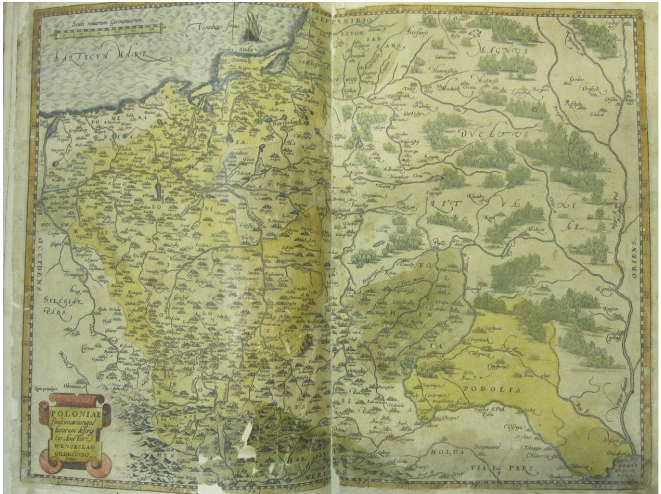
Рис. 1. Карта Польщі Вацлава Гродецького

Карта Польщі В. Гродецького була видана в 1558 р. в Базелі. Вона поглибила тогочасні картографічні уявлення про правобережні українські землі (показчик до карти включав 724 назви). Абрагам Ортелій зменшив карту Гродецького до масштабу 1:2 600 000 і помістив спочатку в першому виданні свого атласу світу, а потім в усіх 16 виданнях «Theatrum...» до 1592 р. [6]. Слід зауважити, що відображення ріки Дніпра на карті Гродецького є достатньо спрощеним і показане майже рівною лінією з незначними звивами (рис. 1).