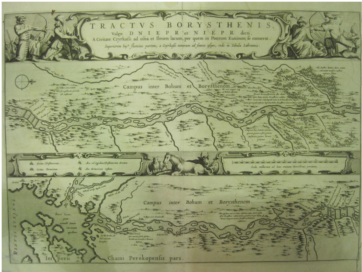
Рис. 3. Карта Йоганна Блау «Руслло Дніпра від міста Черкаси до гирла і озера Ільмень»

Таким чином, Й. Блау повністю повторює Радзивілову карту 1613 р. видання, окрім зміненого орієнтування на захід та невеликих змін у пояснювальних записках та художньому оформленні. Карта друкувалася в атласах фірми Блау Novus Atlas і багатотомному Atlas Maior до 1667 р. У фондах сектору картографії згадана вище карта подана в атласі Блау 1662 р. [11] та окремими листами.