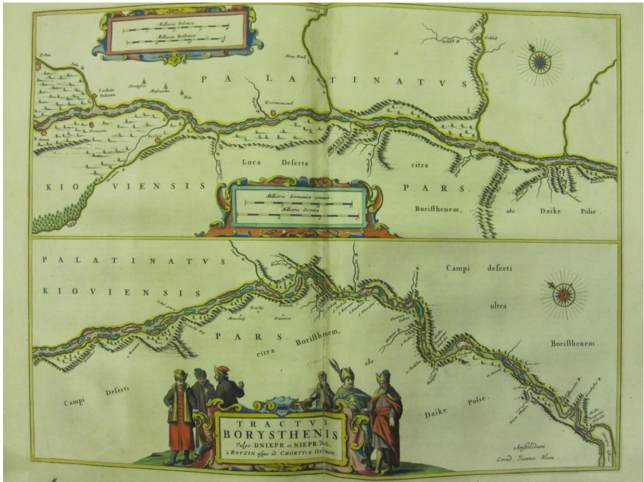
Рис. 5. Карта Г. Боплана «Русло Дніпра від Бужина до острова Хортиця»

Наступні два відрізки Дніпра вміщує карта русла Дніпра від Бужина до острова Хортиця. Tractvs Borusthenis vulgo Dniepr et Niepr dicti, a Bovzin vsque ad Chortusa ostrow (Русло Бористена, або народна назва, Дніпра чи Ніпра- від Бужина до острова Хортиця) (рис. 5). Карта зображає відрізок течії Дніпра, що проходить територією Київського воєводства (Palatinavs Kioviensis Pars) від Бужина до острова Хортиця та навколишні землі по обох берегах. Притоки Дніпра на цьому відтинку: Сула (Sula R.), Тясмин (Taszmien R.), Цибульник (Cybowelnik R.), Сухий Омельник (Suka Omelnik R.), Омельник (Omelnik R.), Ворскла (Worsklo R.), Оріль (Orel R.) та ін. Вздовж русел річок зображено пагорби, а в руслі Дніпра – безліч островів. Нижче Кодака позначено дев'ять порогів і чотири забори. Показано також дві Великі татарські переправи (Welka Przeprawa Tatarska). Як укріплені міста позначені с. Жовнине (Zolnin), Бужин (Bouzin), Чигирин (Czehrin) та ін.