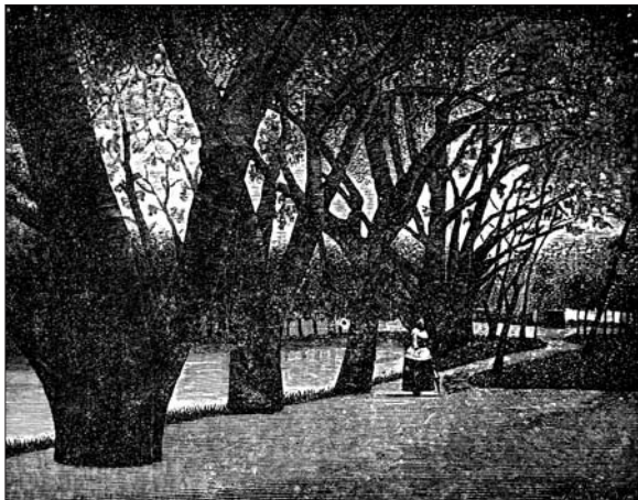
Парк на Хаджибейському лимані (кінець XIX ст.)