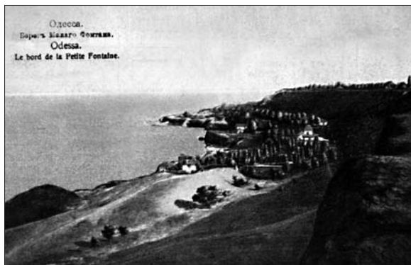
Приморські хутори Одеси, кінець XIX ст.

Граф М.Д. Бутурлін так описує Одесу 1824—1827 рр.: "Наконец добрались мы до Одессы в самую знойную пору года, сопровождаемую месячным, иногда более, бездождем и удушающею пылью от шоссе-ных улиц, от чего нет возможности раск-рыть окно. Вся трава желтеет и сгорает,