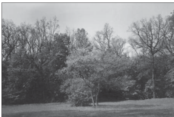
Рис. 2. Cercis canadensis на Китайській галявині дендропарку «Софіївка»

Більшість рослин C. canadensis цвітуть. Під час цвітіння рослини набувають оригінального вигляду і особливої привабливості, завдяки чому вони є перспективними для використання у зеленому будівництві (рис. 2). Серед представників роду Cercis , цей вид є найбільш морозостійким.