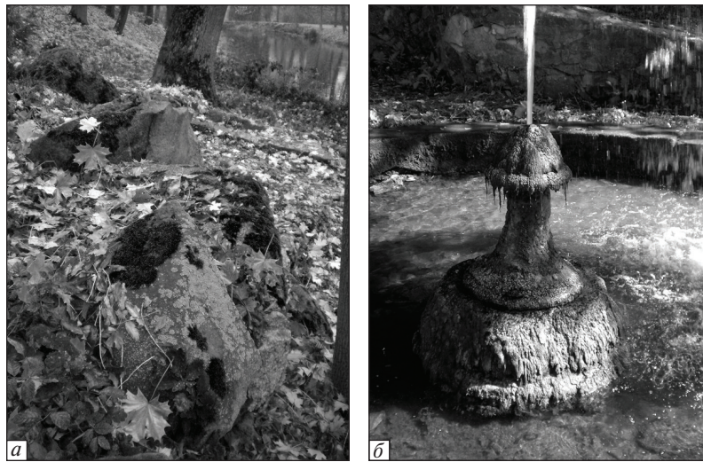
Рис. 2. Місця збору зразків епілітних мохоподібних: a — валуни в центральній частині парку; б — Великий фонтан