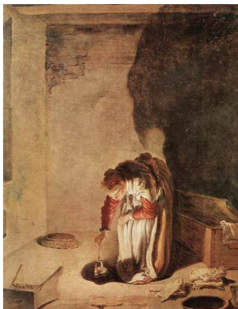
Доменіко Фетті (1588-1623)

Для розвитку цього аспекту варто запропонувати репродукції картин з неявно релігійним сюжетом (наприклад, «Притча про загублену драхму» Д. Фетті, рис. 3),