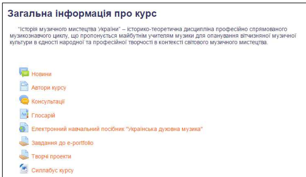
Рис. 1. Фрагмент вікна дистанційного курсу «Історія музичного мистецтва України»

Інформаційна частина має на меті надання студентам необхідної науково-методичної інформації для успішної роботи в електронному навчальному середовищі, а також забезпечення відповідним обсягом теоретичних музично-історичних даних.