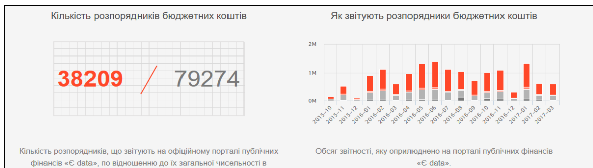
Рис. 5. Приклад візуалізації даних на порталі «Пошуково-аналітична система .007»

Даний інструмент, за аналогією з попереднім, дозволяє студентам у режимі реального часу навчатись на масиві великих реальних даних Міністерства фінансів України.