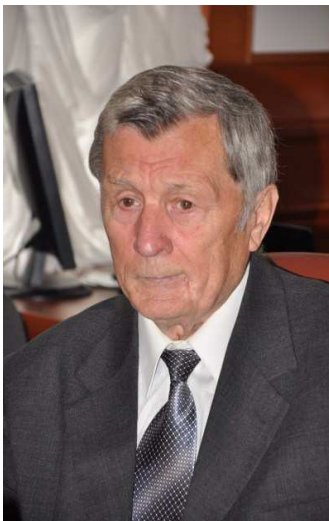
Фото 1. Мирослав Іванович Жалдак

Для проведення цього дослідження першочерговим є аналіз біографічних відомостей про життя і науковий доробок М. І. Жалдака. Адже у роботі [6] визначено, що важливим є аналіз особистості засновника і керівника такої школи як найважливішого чинника її формування. Далі варто розглянути науково-дослідницьку програму школи – коли керівник залучає учнів до власної ідеї, творчості, що передбачає його бажання до колективних форм роботи та потребу в ретрансляції власних поглядів та їх обговорення. Важливою умовою входження до наукової школи, є ідентифікація учня з вчителем, тобто, сприйняття його методів, ідей, способу мислення й діяльності. Ідентифікація учня з вчителем і з науковою школою виступає характерною особливістю наукових шкіл і є надзвичайно важливою для розуміння їх як педагогічного феномена. Наслідування й ідентифікація забезпечує трансляцію і збереження доробку і традицій наукової школи. Проте це не має перешкоджати формуванню самостійності вченого, виявлення його власної професійної і особистісної позиції.