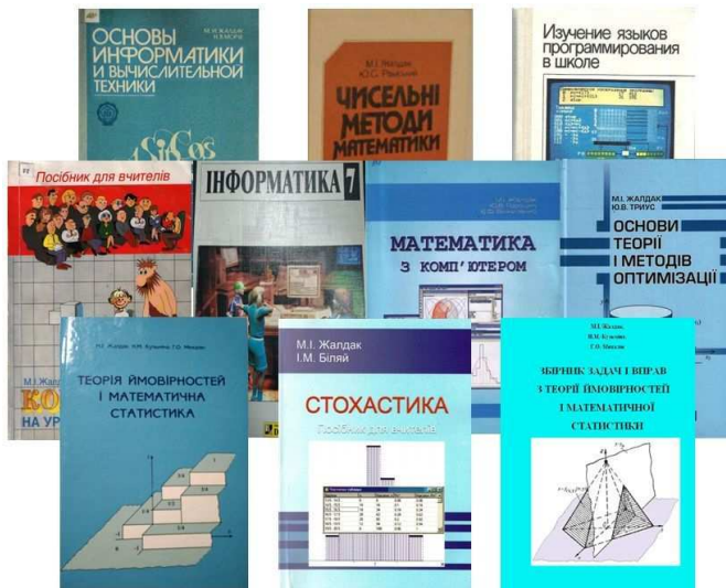
Рис. 1. Основні книги М. І. Жалдака