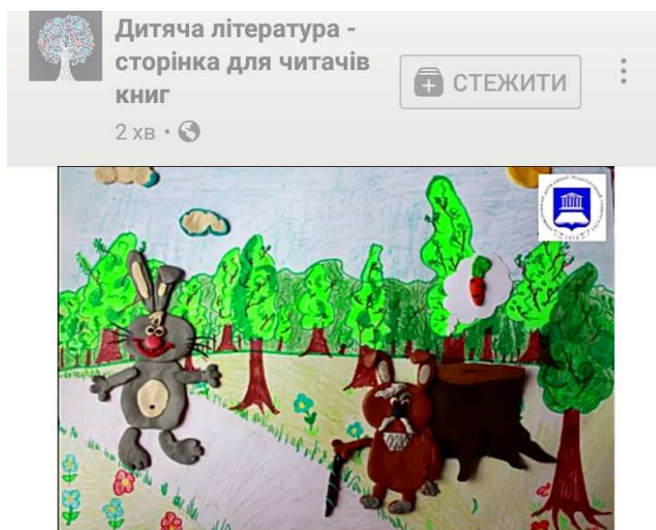
Рис. 1. Буктрейлер на книжку Ю. Ярмиша «Лісова пригода»