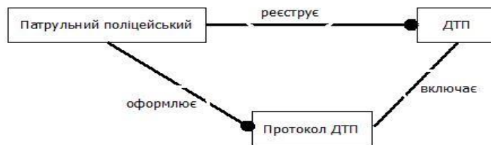
Рис. 1. Структура побудови БД відповідно до особливостей предметної галузі

У теорії та практиці проектування і реалізації БД розрізняють три рівні розгляду предметної сфери та відповідно три рівні моделювання даних, а саме: концептуальний, логічний ( зовнішній ) та фізичний ( внутрішній ). Це сучасні найменування рівнів моделювання даних, відповідних термінології за міжнародними та національними стандартами з інформаційних технологій, зокрема ДСТУ ISO/IEC 2382-17:2005.