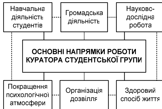
Рис. 2. Схема основних напрямків виховної діяльності куратора студентської групи

Тому на допомогу кураторам пропонується комплекс заходів, що дозволять вдосконалити їх діяльність. Основні напрямки зображено на рис. 2.