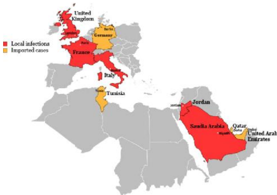
Мал. 1. Розповсюдження вірусу MERS-CoV [1].

Для хворих з MERS характерна клініка тяжкого гострого респіраторного захворювання, у частини розвивається поліорганна недостатність. На сьогодні серед зареєстрованих випадків летальність складає 30 % [6]. Високий рівень смертності пов'язаний з пізньою діагностикою та відсутністю ефективних методів лікування.