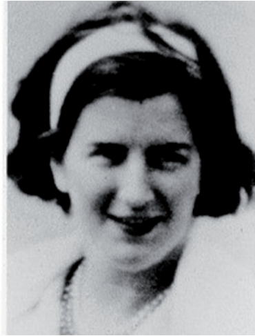
Мал. 2. М.А. Epstein і Y. Barr [10].

лицевих кісток черепа у дітей. Це був один із різновидів лімфом, яка згодом отримала його ім'я. Вчений звернув увагу на те, що новий варіант пухлини трапляється значно частіше в 10 країнах Центральної Африки, де були такі ж показники температури і дощі, що корелювало із високим рівнем захворюваності малярією («країни малярійного поясу»). Саме ці спостереження стали одними із перших в такому напрямку медицини, як географічна патологія [9]. Тому лікар припустив, що можливою причиною розвитку пухлини є якийсь невідомий інфекційний агент, який передається під час укусу комарів. В 1961 році D. Burkitt читав лекцію у Великобританії і ці дані привернули увагу лікаря-вченого М.А. Epstein. І вже 1964 року він із своєю аспіранткою Y. Barr (мал. 2) в перещеплюваній культурі пухлинних клітин хворого на лімфому Беркіта за допомогою електронної мікроскопії виявили вірусні частинки, що нагадували вірус герпесу. Жодний із відомих у той час людських герпес-вірусів (вірус простого герпесу 1-го і 2-го типів і Varicella zoster virus ) не відповідали характеристикам нового вірусу [10, 11].