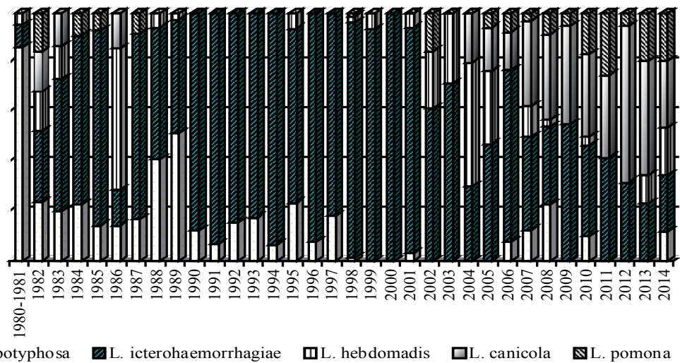
Мал. 2. Етіологічна структура лептоспірозу у хворих на Тернопільщині (щорічна питома частка збудників, 1980-2015 рр., %).

до лептоспір серогрупи Grippityphosa ; в основного мешканця домашніх осередків сірого пацюка – лише Icterohaemorrhagiae . Від жовтогорлої полівки і хатньої миші, в тому числі у домашніх осередках, знаходили також Hebdomadis . У людей за той же період реєструвались захворювання, спричинені як перерахованими збудниками, так і Canicola та Pomona (1982 р.), у подальшому Kabura (2005), Polonica (2007), яких у гризунів до того часу не виявляли (мал. 2). Також у 2010 р. зареєстровано випадок лептоспірозу в людини, спричинений L. australis – зараження, ймовірно (за даними