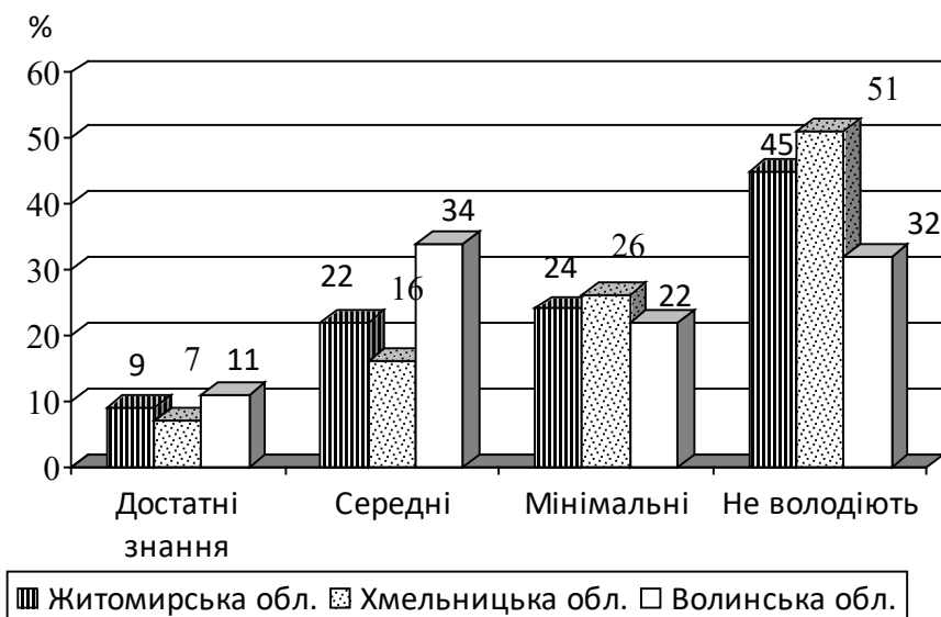
Мал. 1. Власна поінформованість про хворобу Лайма працівників лісу Житомирської, Хмельницької та Волинської областей.

Іспанії – 9,3 %, Норвегії – 16 % [10]. За нашими даними, частота серопозитивності щодо комплексу B. burgdorferi sensu lato серед зазначених працівників у Тернопільській області склала 43,3 % [11].