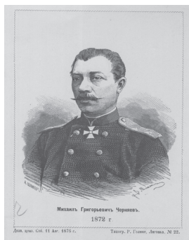
Генерал М.Г. Черняев