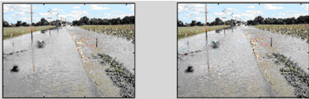
Рис. 1. Изображение I группы качественной оценки: оригинальное изображение (а); измененное изображение (б)