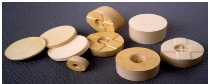
Рисунок 1 – Примеры пороховых элементов для охотничьего ружья 12 калибра и ПМ (9-мм), изготовленных по N&L-технологии

Как видно (рис. 1), пороховые элементы внешне похожи на брикеты овальной формы или таблетки, что послужило поводом для некоторых обозревателей назвать эти элементы таблеточным порохом. По-видимому, логично было бы назвать их N&L-порохом. Однако название не меняет специфиче-