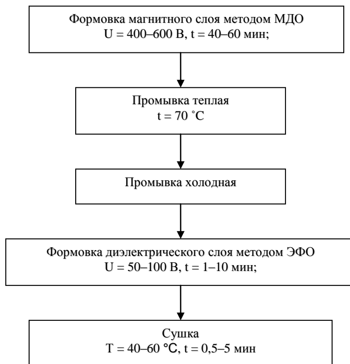
Рисунок 1 – Блок-схема процесса формирования многослойных покрытий активными диэлектриками