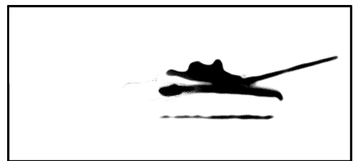
Рисунок 2 – Сравнительные изображения тепловыделений танка: а – с работающим основным двигателем; б – с работающей ВСУ