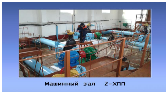
Рисунок 3 – Насосная станция

На снимке (рис. 3) показана типичная насосная станция и уровень оборудования, установленного 30–50 лет назад, эксплуатируемая практически во всех регионах Украины.