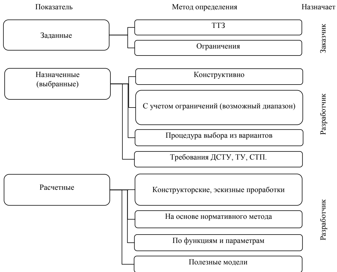
Рисунок 3 – Структура показателей PDM протокола

Стандарты серии ISO 9000 распространяются на машинно-ориентированное представление данных об изделии и обмен этими данными. Целью является создание механизма, позволяющего описывать данные об изделии на протяжении всего жизненного цикла изделия независимо от конкретной системы. Характер такого описания делает его пригодным не только для обмена инвариантными файлами, но также и для создания баз данных об изделиях, коллективного пользования этими базами и архивации соответствующих данных.