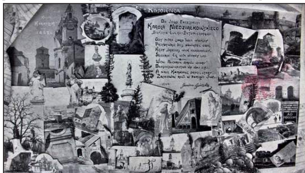
Рис. 5. Фотографія-колаж

У фондах Кам'янець-Подільського державного історичного музею-заповідника ми виявили фотографію авторства Л. Раковського, наклеєну на велике паспарту (рис. 5). Це фотоколаж із 43 зображень історичних пам'яток Кам'янця-Подільського, кожне з яких має підпис. У центрі вгорі є напис «Z Kamienska», а нижче на імпровізованому клаптику паперу – вірш поетеси Яніни Гурської «Do Jego Excelencyi Karola Niedzialkowskiego biskupa Lucko-Zytomierskiego», датований 1904-м роком. У лівому нижньому куті є фото Леона Раковського з його власноручним підписом. Уся композиція обрамлена вишитим рушником із типовим подільським орнаментом [12].