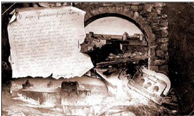
Рис. 2. Листівка-колаж 1