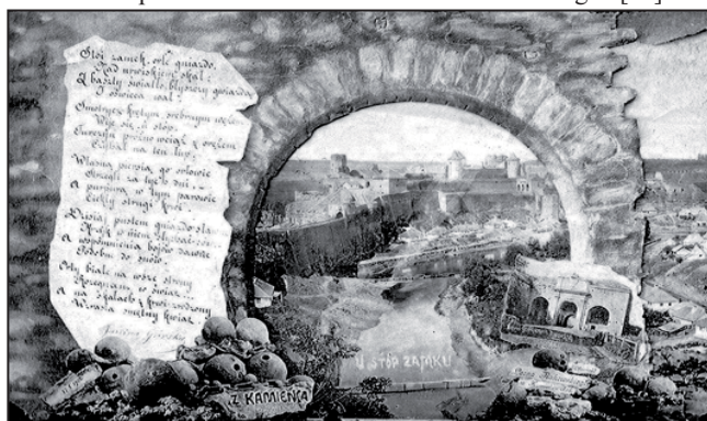
Рис. 3. Листівка-колаж 2