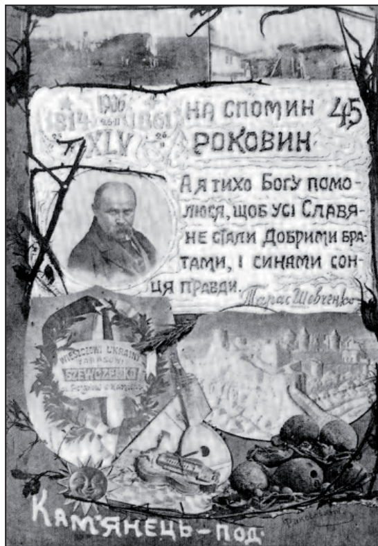
Рис. 6. Пам'ятна листівка в честь 45 роковин смерті Т.Г. Шевченка

барельєфа Турецької фортеці, кобзи, ліри, чавунних ядер, шістнадцятипроменевого сонця, двох панорамних сільських видів. Уся композиція обрамлена гілками черсаку. Поруч у лавровому вінку вміщено фігурну таблицю з написом польською мовою «Співцєви України Тарасові Шевченку від поляків Кам'янця». Поряд з портретом поета є рядки з поеми «Єретик». У нижній частині – напис «Кам'янець-Под» та прихований підпис Л. Раковського українською мовою. Листівка містить дати життя поета «1814-1861», дату роковин «45» та дубльовану дату латиною «XLV». На другій листівці також зображено колаж із портрета Т.Г. Шевченка, барельєф Турецької фортеці, кобзи, ліри, лаврового вінка з аналогічним написом попередньої листівки та рядків з поеми «Єретик» [6, с.524]. На третій листівці теж зображено колаж із портрета Тараса Григоровича Шевченка, обрамлений у вишиваний рушник, під яким розміщено квітковий вінок, стилізований під ліру та бандуру. Між ними у круглій розетці зображено латинську цифру «XLV». Нижче у великому круглому щитку є напис великими літерами «Слава не поляже», а нижче: «Подільське українське товариство Просвіта». Глом для колажу слугує візерунковий килим і квіти бузку [7].