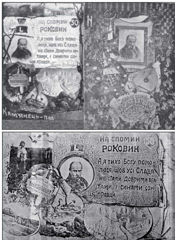
Рис. 7. Перевидана серія листівок в честь 50 роковин смерті Т.Г. Шевченка