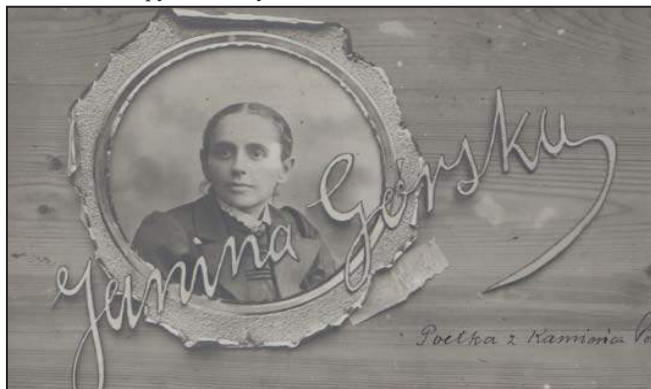
Рис. 4. Листівка-колаж з портретом поетеси Я. Гурської

Ще одна поштівка (рис. 4), датована 1906-м р., має фон дерев'яної дошки, на якій у стилізованій круглій рамці вміщено жіночий портрет із написом «Janina Górska», виконаним із художнім смаком. Праворуч трохи неохайним почерком написано: «Poetka z Kamienska Pod.». З-під рамки видно стилізований клаптик паперу, на якому ледь помітно виведено: «L. Rakowski» [15].