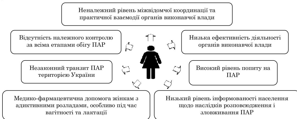
Рис. 1. Невирішені питання, що спричиняють поширення адиктивних розладів серед жінок

на допомога; нагляд та моніторинг 3 . Крім того, у 2010 р. Кабінетом Міністрів України було схвалено Концепцію реалізації державної політики у сфері протидії поширенню наркоманії, боротьби з незаконним обігом наркотичних засобів, психотропних речовин та прекурсорів на 2011-2015 рр. Метою даної Концепції було визначення шляхів та пріоритетів державної політики у сфері протидії поширенню наркоманії, боротьби з незаконним обігом наркотичних засобів, психотропних речовин та прекурсорів, зміцнення здоров'я нації, а також зменшення негативних соціальних, економічних та інших наслідків, пов'язаних із вживанням наркотичних засобів та психотропних речовин 14 . Проте, незважаючи на функціонування низки державних планів і програм, спрямованих на протидію поширенню адиктивних розладів здоров'я серед населення, все ще залишаються актуальними питання щодо збереження здоров'я жінок (рис. 1).