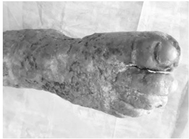
Рис. 4. Хвора Г., 50 років. Через 3 міс після операції

установлено діагноз: Карциноїдний папіломатоз шкіри Готтрона правої нижньої кінцівки (МКБ 10 — L94.4). Лікувалася самостійно. Останні три роки страждає на цукровий діабет.