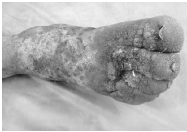
Рис. 1. Хвора Г., 50 років. Карциноїдний папіломатоз шкіри Готтрона. На момент госпіталізації

Хвора Г., 50 років, госпіталізована 22.10.2017 р. у Центр термічної травми та пластичної хірургії м. Дніпро зі скаргами на бородавчасті розростання в ділянці правого гомілковоступневого суглоба і правої ступні, гнійне виділення з неприємним