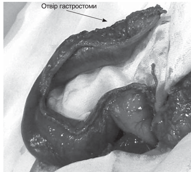
■ Рис. 2. Етап формування циліндра з великої кривизни шлунка

Через 2 тиж після виписки з лікарні дитина важила 5300 г, об'єм харчування — до 100 мл сумі-