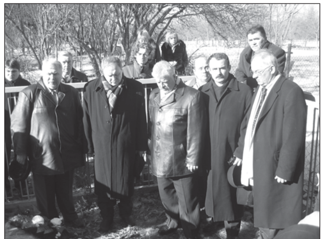
Учасники II Скліфосовських читань, секції дитячих хірургів покладають квіти на могилу М.В. Скліфосовського, м. Полтава, 2006 рік