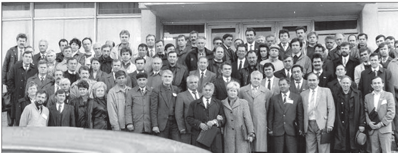
У конференція дитячих хірургів України. Кременчук, 1992 рік

на, Тенеріфе, Рим, Афіни, Будапешт, Ейлат), у матеріалах яких відображений досвід роботи кременчуцьких дитячих хірургів.