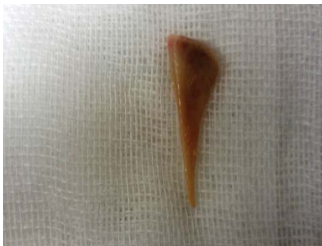
Рис. 3. Извлеченное инородное тело(куриная косточка) из главного бронха

Таким образом, значительный процент легочных осложнений, вследствие аспирации ИТ в дыхательные пути, обусловлен длительностью аспирации, природой инородного тела, глубиной проникнове-