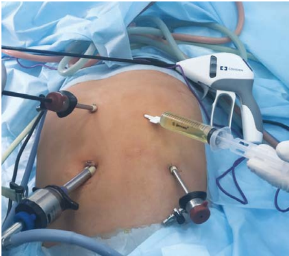
Рис. 1. Розташування портів при лапароскопічній корекції кісти селезінки

тривалий безсимптомний перебіг захворювання. Перші клінічні ознаки цієї патології з'являлися лише тоді, коли кісти досягали великих розмірів, або під час планового ультразвукового дослідження.