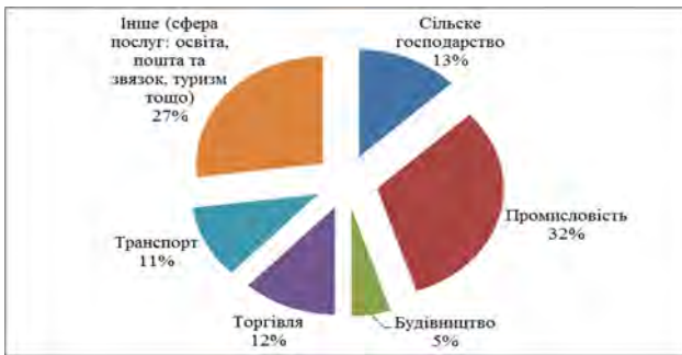
Рис. 1. Структура економіки України за галузями за 2010-2011 рр.

тому числі 4,3 тис. ліцензованих туристичних операторів та туристичних агенцій, 3,3 тис. санаторно-курортних закладів.