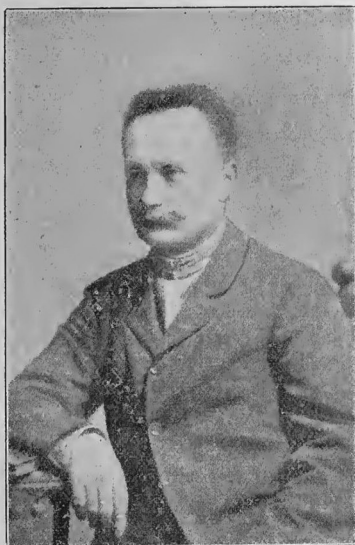
Іван Франко (1856—1916).

Як учений причинив ся Він чимало до того, що наше „Наукове товариство“ підняло ся нині до рівені заграничних академій наук. Писав у великих напрямках наук, знайомив нас із вислідами світової науки, виховував молоді вчені сили, показав світові, що й у нас, у тих Українців, про яких світ мало що знає, є своя наука, є наукова традиція, є охота доложити свою пайку до загальної скарбниці людського знання.