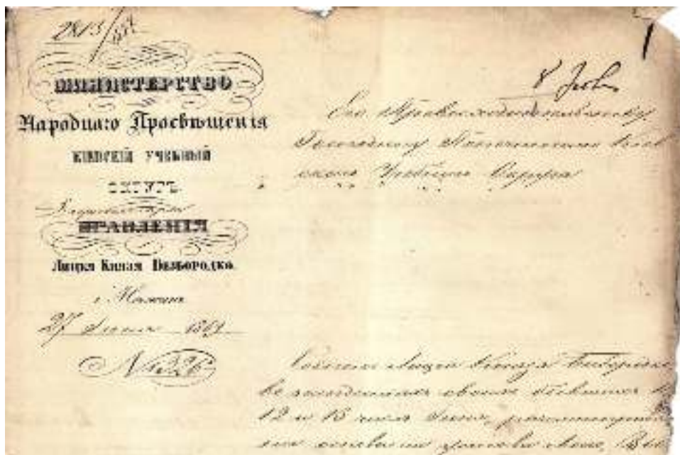
Фото 4. Фрагмент протоколу засідання ради Лицею князя О. Безбородька щодо видачі атестатів випускникам (1869 р.)