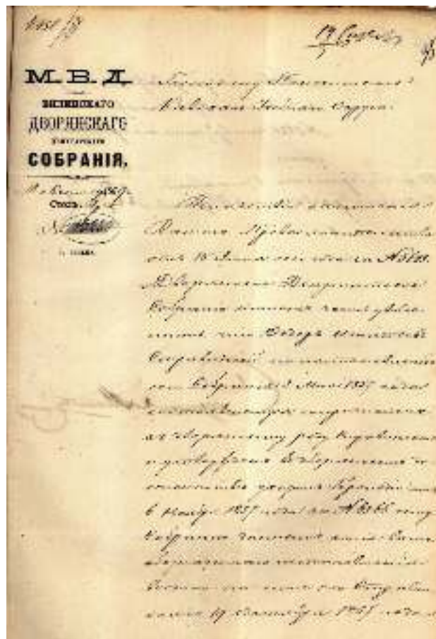
Фото7. Відповідь Віленського депутатського дворянського зібрання Міністерству народної освіти на підтвердження дворянської приналежності студента Ф. Стравінського

Стаття надійшла до редакції 17.09.2017 р.