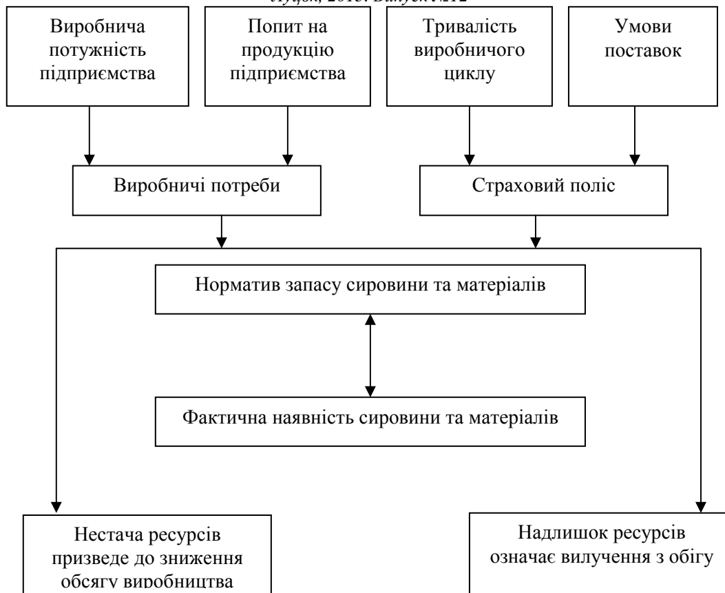
Рис. 1. Оцінка необхідності сировини та матеріалів для виробничого процесу підприємства [10]

При наявності залишкової сировини та матеріалів необхідно визначити ціну кожного виду сировини і тільки тоді можна виявити суму, яку суб'єкт господарювання затратив на придбання залишкової сировини.