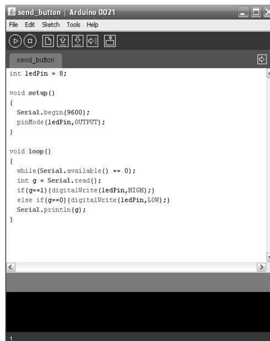
Рис.2. Інтегроване середовище розробки Arduino

Для розробки та завантаження програмного коду на плату Arduino використовуємо середовище Arduino IDE (рис.2). Воно включає великий набір бібліотек C/C++ для роботи з операціями вводу/виводу, контролю роботи сервоприводів, передачі інформації і т.д.