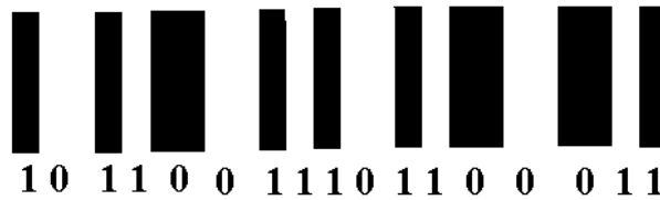
Рис. 2. Бітова послідовність в вигляді штрихового коду

Другим способом представлення бітової послідовності в вигляді штрихового коду є спосіб коли '0' та '1' задані не різними кольорами, а різними значеннями ширини штрихів. Тобто маємо чотири атомарні графічні символи два вузькі штриха та два широкі білого та чорного кольорів. В такому штриховому коді білі та чорні штрихи весь час йдуть почергово, а значенням '0' та '1' відповідають відповідно широкі та вузькі штрихи. В цьому разі наведена вище бінарна послідовність буде мати вигляд: