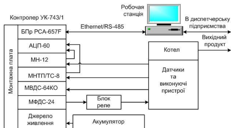
Рис. 1. Структура системи автоматизації керування

Перелік та характеристика модулів ПЛК наведена в табл. 1.