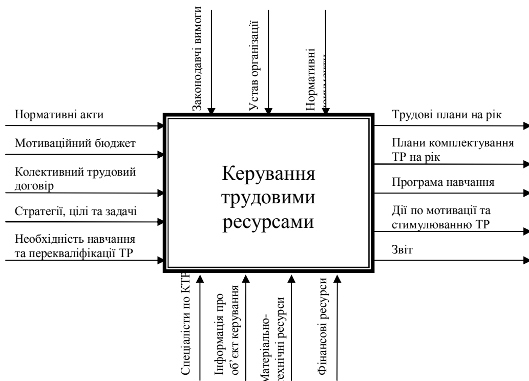
Рис. 2 – Покращення процесу КТР

Таким чином, впровадження системи менеджменту якості СМЯ в процес управління персоналом підприємства вимагає ретельного дослідження, оскільки в ньому беруть участь як внутрішні суб'єкти (засновники, керівники, профспілка, комісії по трудових спорах, HR-менеджери), так і зовнішні (органи державної влади, контрольно-ревізійні служби, кадрові агентства, споживачі), та обов'язки між ними розділити непросто в силу відмінності інтересів (рис. 2).