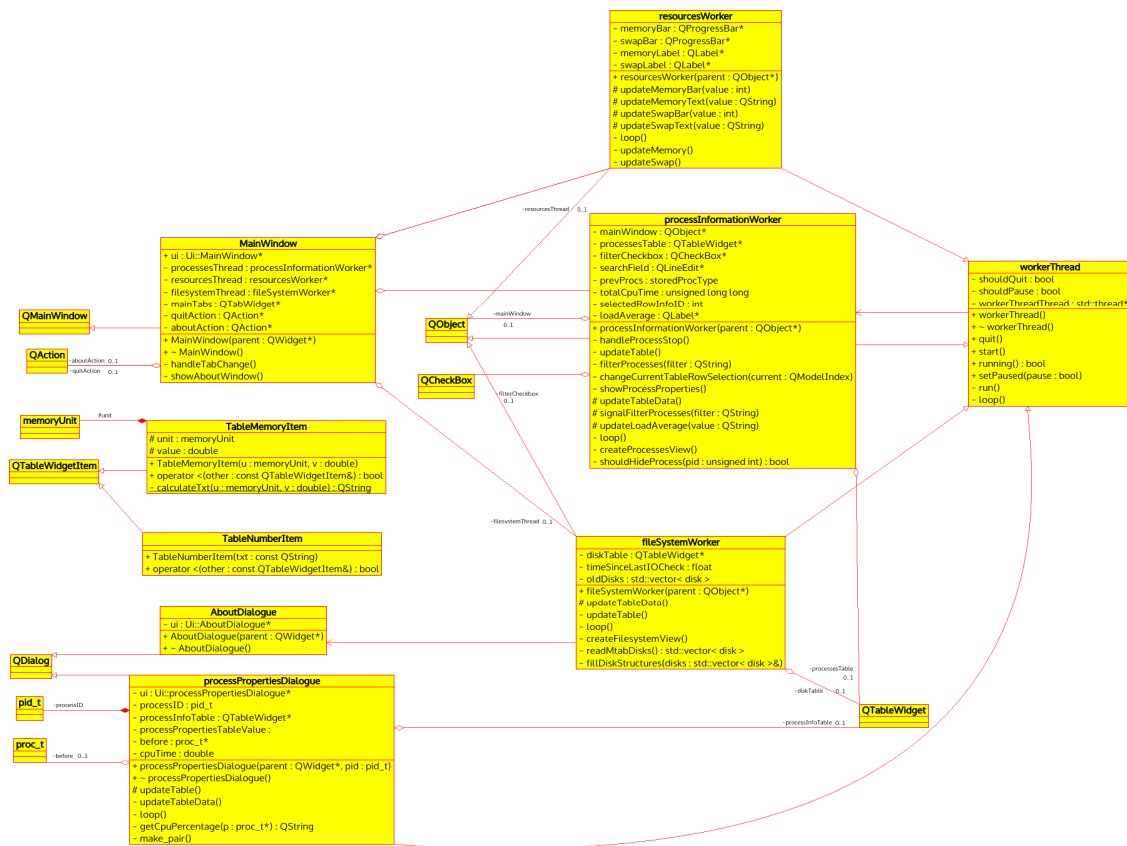
Рисунок 3 — UML діаграма класів додатку

Висновки. В результаті проведеного дослідження була створена невелика утиліта — системний монітор, що виводить список виконуваних процесів системи із можливістю їх завершення, також надає інформацію про примонтовані файлові системи і пам'ять.