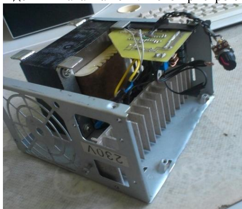
Рис. 2. Зовнішній вигляд розробленого DC-AC перетворювача

Наприклад, інвертор, розрахований на напругу джерела 12В, працює від розрядженого акумулятора з напругою 10В. При цьому амплітуда напруги на виході знижується пропорційно до 259В. Схема управління змінює коефіцієнт заповнення вихідної напруги до 0.72, при цьому ефективна напруга залишається рівною 220В. Проте форма напруги та її амплітуда змінюється, а це може бути недопустимо для деяких навантажень. Фото пристрою представлено на рис. 2.