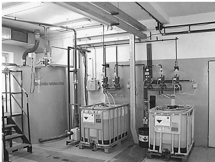
Рис. 1. Змішувач-реактор непроточного типу та реагентні баки заводського виготовлення з насосами-дозаторами реагентів для очищення стічних вод від шестивалентного хрому підприємства «Lukas autobrzdy» (м. Яблонець над Нісою, Чехія) (власна розробка)

Головна увага повинна приділятися повній автоматизації процесу знешкодження стічних вод. Для цього рекомендується використання ступінчастого дозування реагентів для зміни рН та Eh у потрібному напрямку [15]. Якщо необхідне окислення домішок застосовують окисні реагенти з поступовим підвищенням Eh, якщо відновлення – відновлювальні реагенти з поступовим зниженням Eh до необхідного значення. В залежності від хімічних властивостей окисника або відновника для регулювання рН застосовують луг або кислоту.