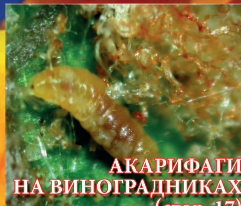
АКАРИФАГИ НА ВИНОГРАДНИКАХ (стор. 17)