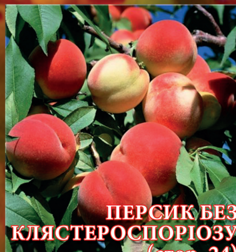
ПЕРСИК БЕЗ КЛЯСТЕРОСПОРІОЗУ (стор. 24)