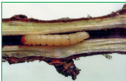
Рис. 1. Личинка смородинової склівки

За літературними даними [1-3] у травні гусениці смородинової склів-