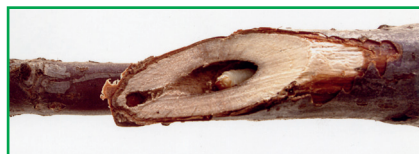
Рис. 2. Камера для заляляковування біля попередньо вирізеного отвору

Обстеження насаджень смородини чорної та облік заселеності гілок виконували за загальноприйнятими методиками у ентомології [5]. Для обліків чисельності смородинової склівки з чотирьох сторін і посередині із кожного облікового куща відбирали по одній гілці, що в сумі