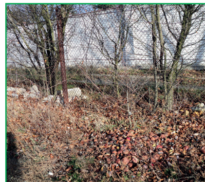
Фото 1. Викинуті за межі ділянки гнилі яблука