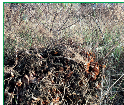
Фото 2. Купа відмерлих чорнобривців забруднює природу