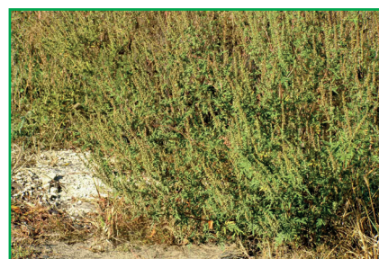
Фото 3. Викинуті залишки вапна, на них поселилась амброзія полинолиста

собі закладки компост не вимагає ворушіння. Якщо він закладений у теплу погоду, то придатний до використання вже через півроку за умов, що тут не закладені бур'яни з насінням. У протилежному випадку компост має “дозрівати” 3 роки, а в разі присутності карантинних бур'янів — 5 років! Готовий компост має коричневий колір і розсіпчасту дрібно-грудкувату структуру.