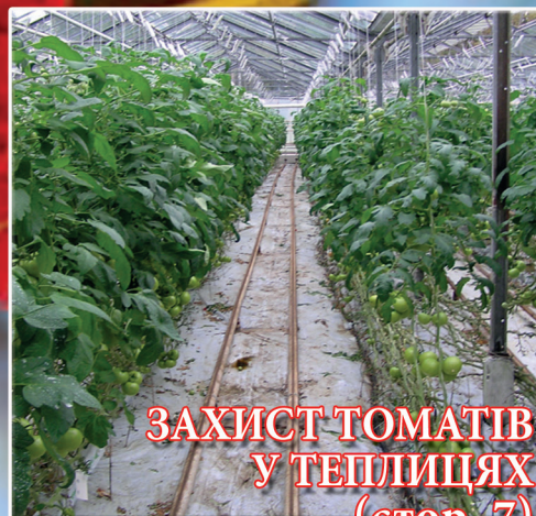
ЗАХИСТ ТОМАТІВ У ТЕПЛИЦЯХ (стор. 7)