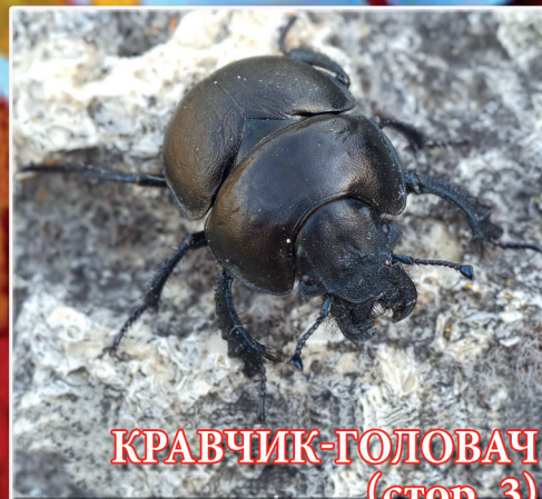
КРАВЧИК-ГОЛОВАЧ (стор. 3)