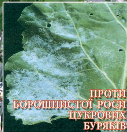
ПРОТИ БОРОШНИСТОЇ РОСИ ЦУКРОВИХ БУРЯКІВ (стор. 7)