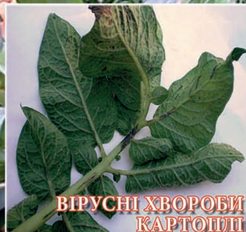
ВІРУСНІ ХВОРОБИ КАРТОПЛІ (стор. 10)